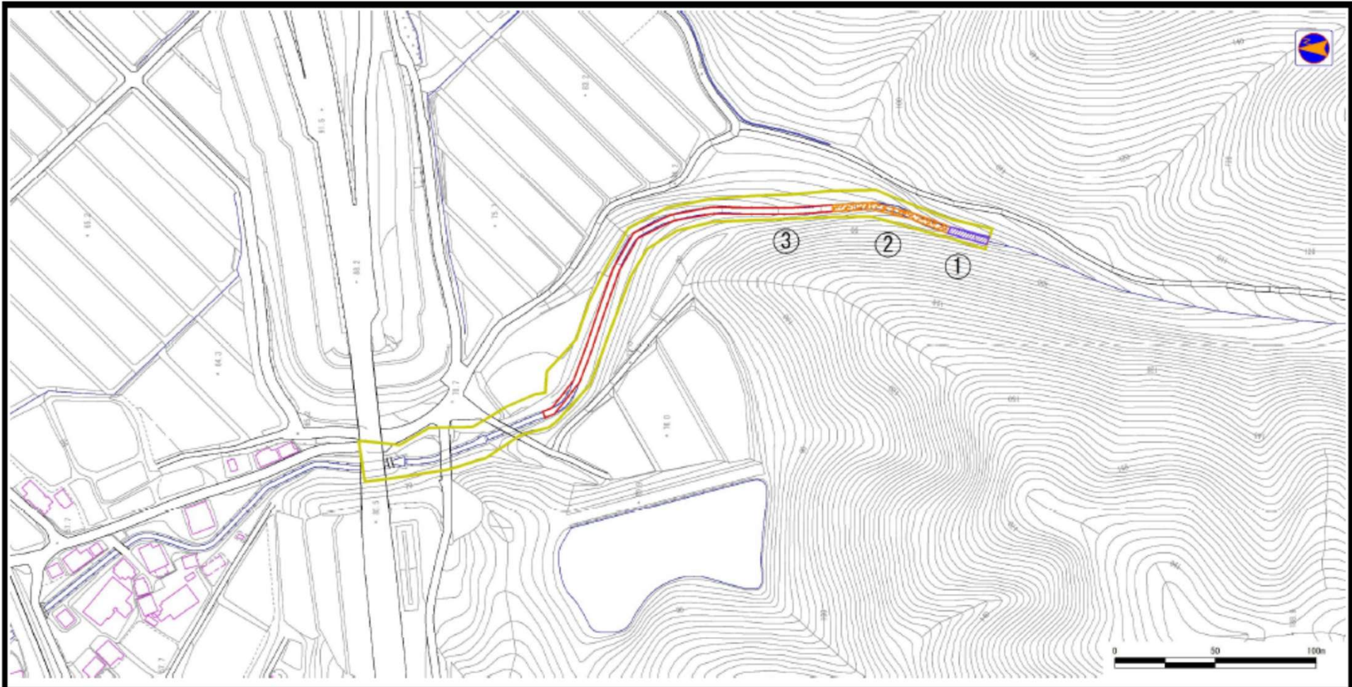
様式-2(土) 土砂災害警戒区域・土砂災害特別警戒区域 区域図(その1)