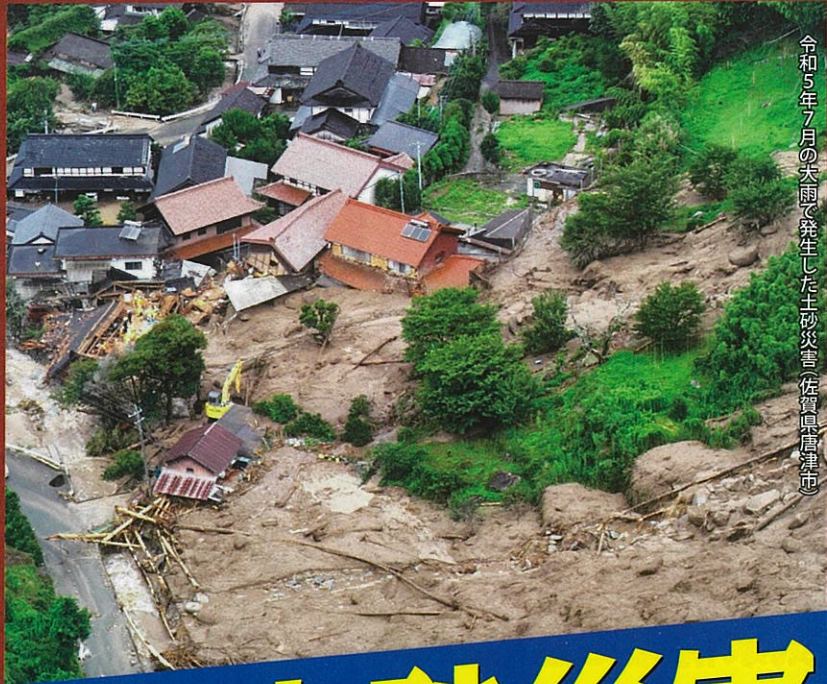
令和5年7月の大雨で発生した土砂災害(佐賀県唐津市)