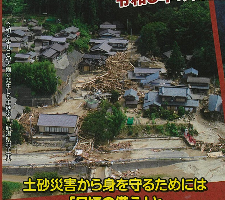
令和4年8月の大雨で発生した土砂災害(新潟県村上市)