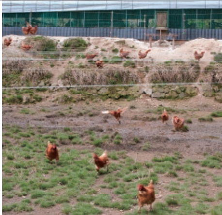
Nisyu farmers market