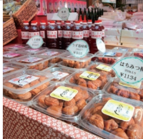
Nisyu farmers market

住 所/若狭町成出17-4-1 T E L/0770-46-1501 営業時間/8:30~17:30 定休日/無休 (年末年始を除く)