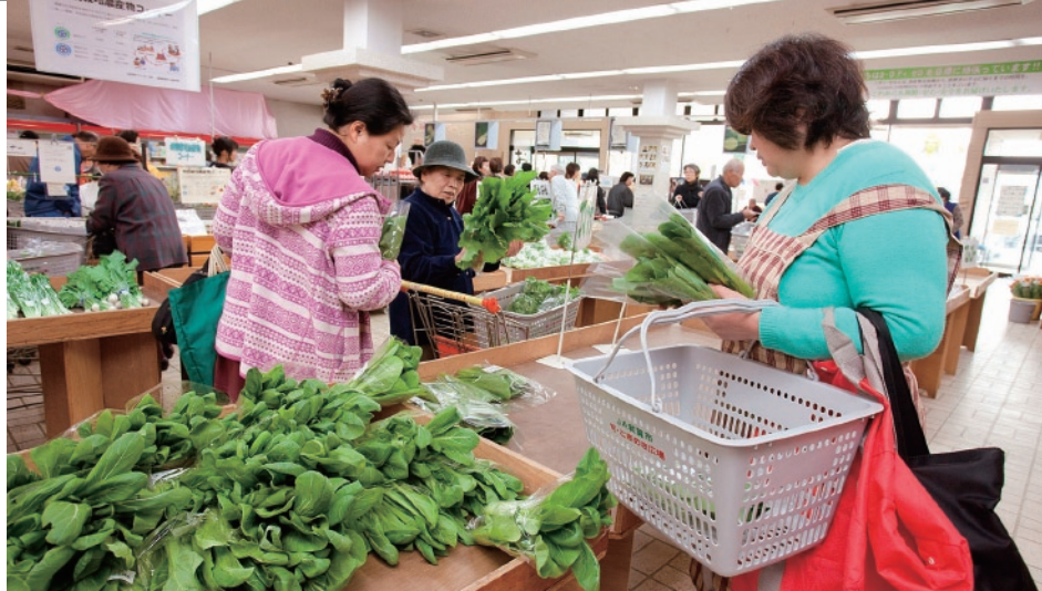
Nisyu farmers market