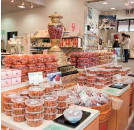
Nisyu farmers market

住 所/美浜町久々子8-10-1 南西郷漁業協同組合 直売所内 T E L/0770-32-2283 営業時間/10:00~17:00 定休日/火曜日