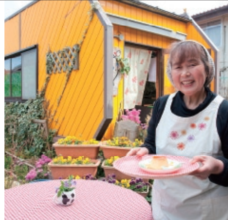
Nisyu farmers market

住所/敦賀市木崎78-2-1 (敦賀短期大学入口) TEL/0770-22-0624 営業時間/14:00~18:00 定休日/水曜日