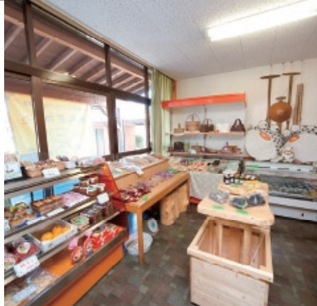
Nisyu farmers market