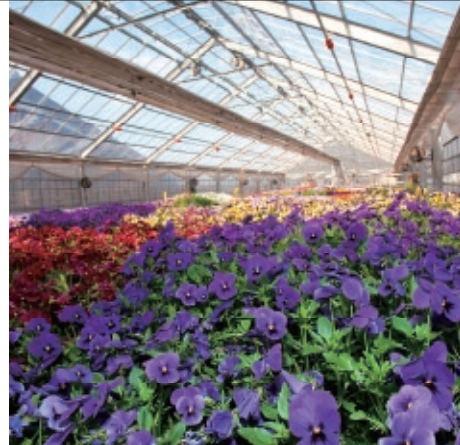
Nisyu farmers market

住所/美浜町山上68-4 TEL/0770-37-2560 携帯/090-5681-6720 営業時間/9:00~15:30 (予約制) 定休日/不定休