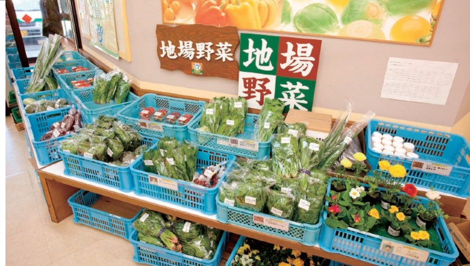
Nisyu farmers market