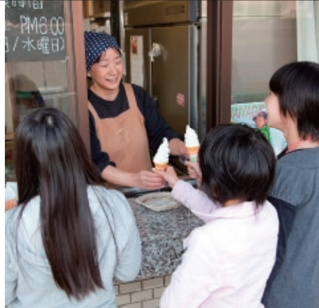
Nisyu farmers market

住所/敦賀市春見81-2-2 TEL/0770-21-0063 営業時間/13:30~17:00 定休日/不定休