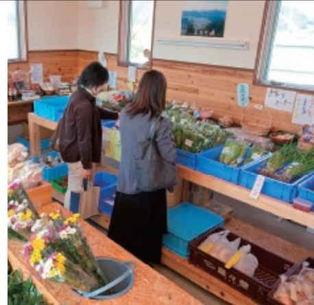
Nisyu farmers market

住 所/若狭町倉見5-8 T E L/0770-45-2115 営業時間/ 8:00~18:30 (平日) 9:00~18:30 (土、日、祭日) ※11月~3月は17:30まで