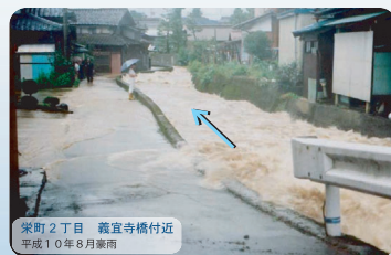
栄町2丁目 義宣寺橋付近 平成10年8月豪雨

住民の生命と財産を守るため、平成4年から事業を着手して以来、地域の協力のもと、現川改修と元禄線放水路が完成し、大きな浸水被害が発生した平成10年8月豪雨に対して安全に流せる河川となりました。