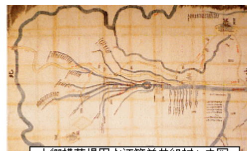
十郷横落堤用水江筋并井組村々之図 (安永2年、1773年)