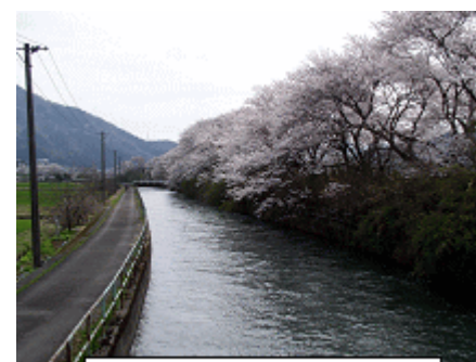
鳴鹿堰付近の桜並木

現在、施設の老朽化等に伴い、機関水路のパイプライン化を行っています。その水路上部を有効利用して地域住民に親しまれる空間を創出するため、地域住民とのパートナーシップにより様々な取り組みが展開されています。