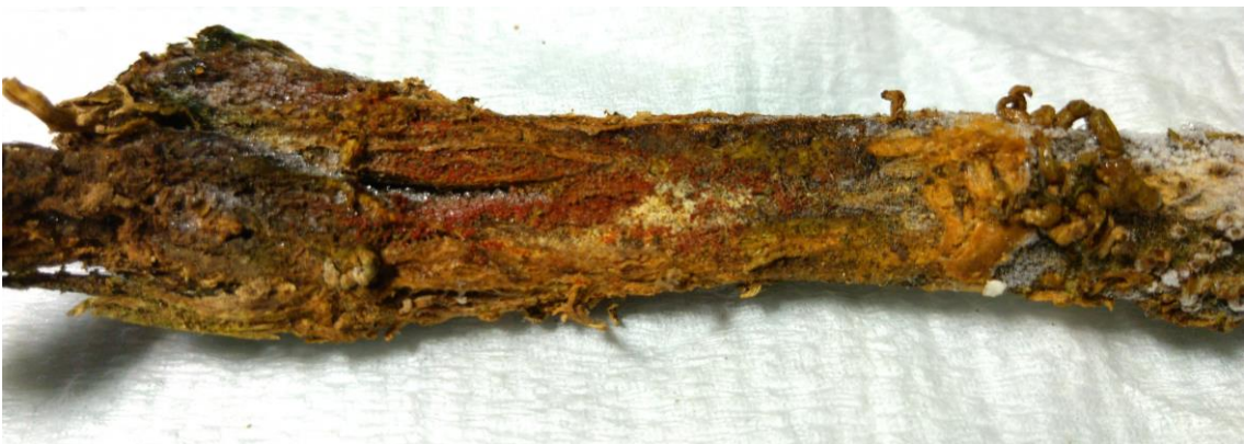
写真2 罹病部に形成された赤い子のう殻