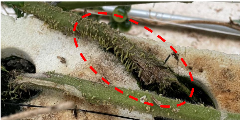
写真1 地際部の黒変、ひび割れ