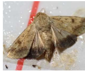
図2 オオタバコガ成虫