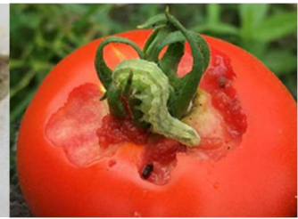
図3 オオタバコガ幼虫