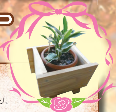
※写真の観葉植物と鉢は賞品に含まれておりません