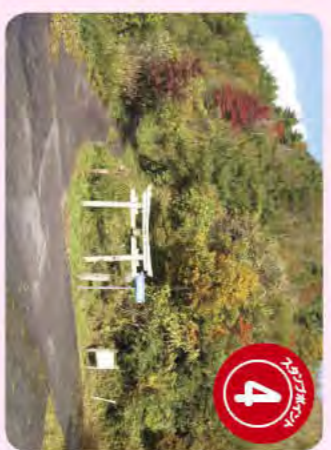
城山 (栗屋城跡入口)