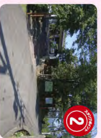
金華山グリーンランド