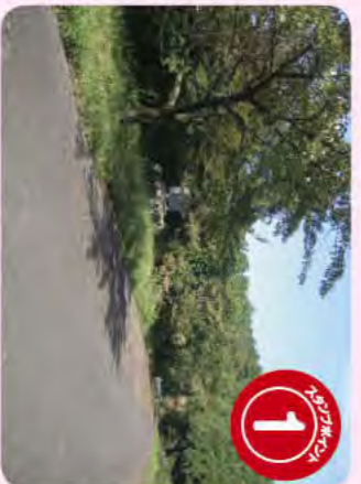
越前西部1号線完成記念碑