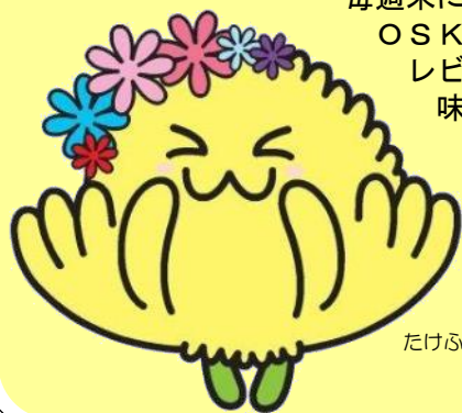
たけふ菊人形マスコットキャラクター きくりん

遊園地のアトラクション、 毎週末に開催されるイベント、 OSK日本歌劇団によるたけふ レビュー、ご当地グルメが 味わえるフードコートなど 他にもたくさん 見どころがあるリン♪