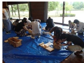
木製プランターカバー作り