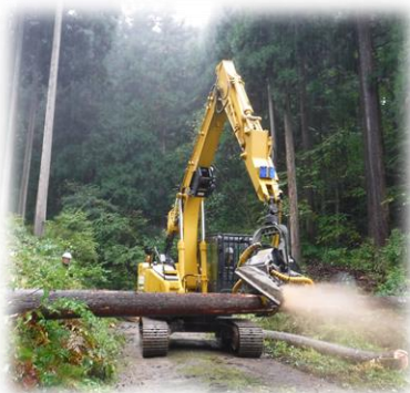
枝打ち、伐採作業を間近で見学