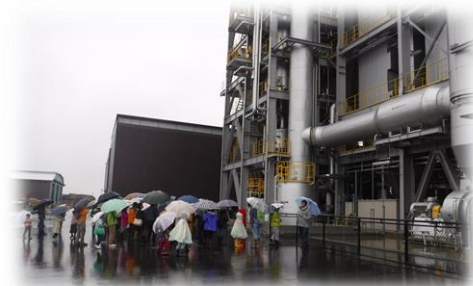
木質バイオマスセンターを視察

未利用材をチップ化して燃料に使い、電力として供給する木質バイオマス発電に関心を持ってもらおうと、10月22日（日）にウッドターミナル美山でバスツアーが開催されました。一般参加者約70名が、山から木を切り出す作業や発電所を見学し、木質バイオマス発電について理解を深めました。 このほか、山のクイズや木工教室などのコーナーもあり、親子で楽しめるイベントとなりました。