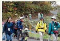
林道ウォーク開催