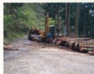
林道からの木材積み込み

森林は光合成により、大気中の二酸化炭素を吸収・固定して成長します。間伐をすることで、木が大きく成長できるようになり、伐った木材も、エネルギー負荷の少ない環境に良い資材として使用できます。