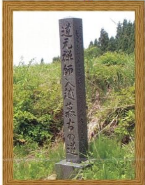
道元禅師入道墓古の道