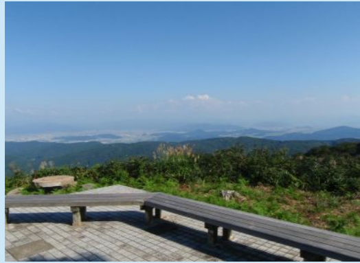
国見岳森林公園の展望

山火事防止のため、タバコのポイ捨てはしないでください。 ゴミは捨てないで、持ち帰ってください。