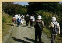
林道ウォーク開催