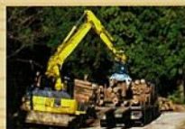
林道からの木材積み込み

森林は光合成により、大気中の二酸化炭素を吸収・固定して成長します。間伐をすることで、木が大きく成長できるようになり、伐った木材もエネルギー負荷の少ない環境に良い資材として使用できます。