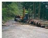
林道からの木材積み込み

森林は光合成により、大気中の二酸化炭素を吸収・固定して成長します。間伐をすることで、木が大きく成長できるようになり、伐った木材も、エネルギーの少ない環境に良い資材として使用できます。