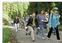
林道ウォーク開催