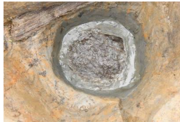
柱穴の中に敷いた植物