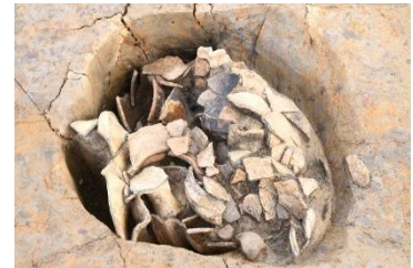
柱穴の中に捨てられた土器