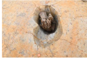
柱穴から見つかった柱の根元