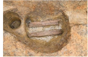
柱穴の中に敷いた板