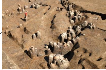
溝から見つかった土器