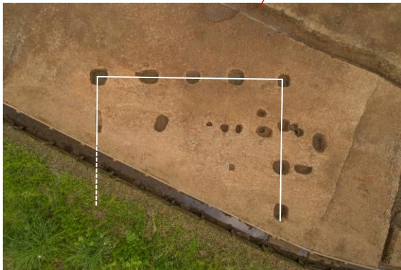
掘立柱建物（調査区外へ伸びる）