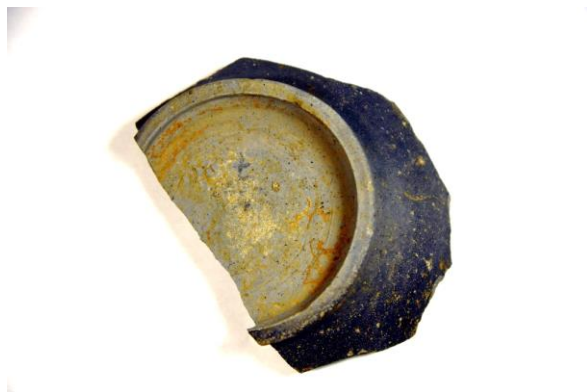
須恵器（墨書で「寺」？と記載）