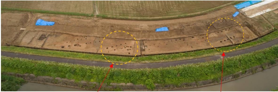
調査区全景（東から）