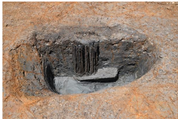
柱根（直径約 20 cm）と柱を支える礎板