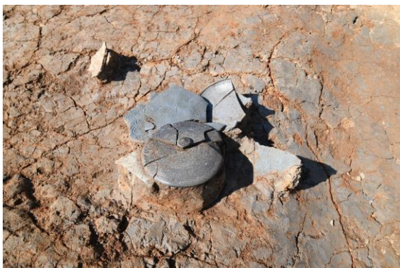
遺物（須恵器の蓋と甕）出土状況