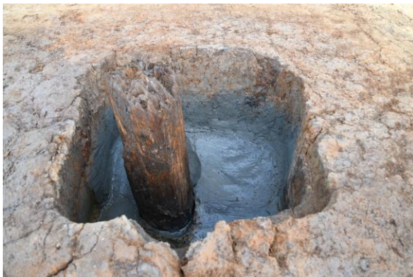
柱穴（長軸約 80 cm）と柱根（直径約 30 cm）