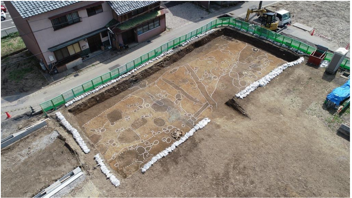
調査区全景（北東から）