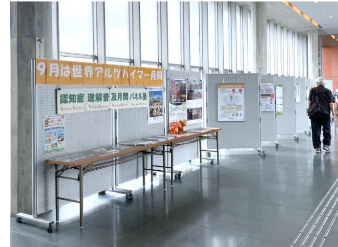
（左から）オレンジハート運動CM、オレンジライトアップ（一乗谷朝倉氏遺跡）、啓発パネル展（県立図書館）