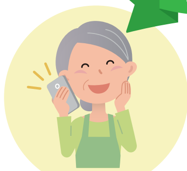
もっと電話でつながろう