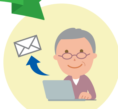
メールでつながろう