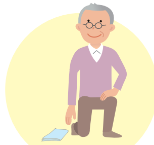
腰を落として床の物を拾う