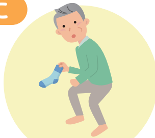
立位で靴下を履く