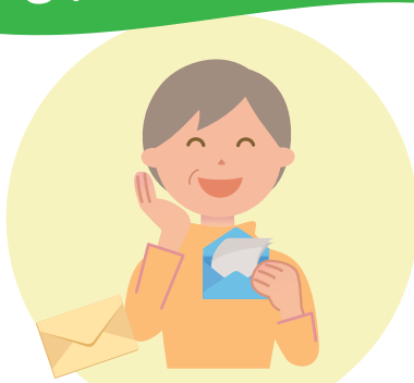
手紙でつながろう