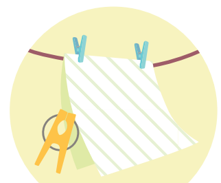
洗濯ばさみをタオルに挟む