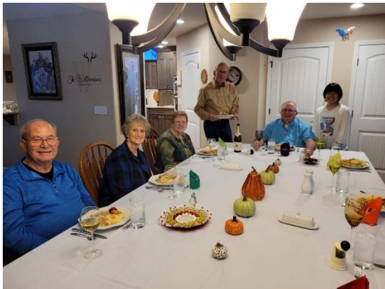
ホストファザーの家で Thanksgiving dinner