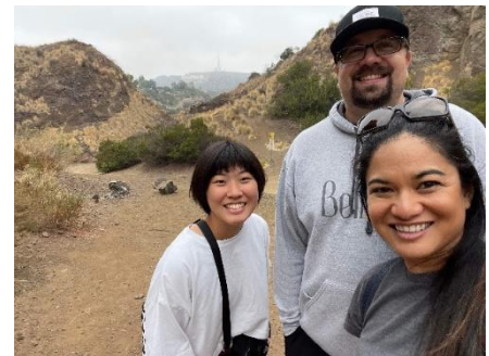
ハリウッドサインの近くで