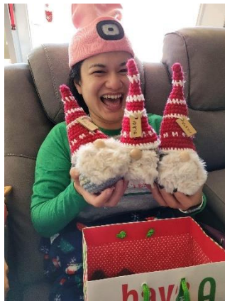
手作りの編みぐるみをプレゼント