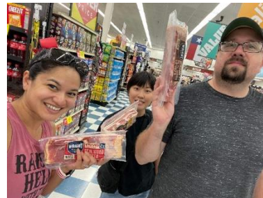
ベーコンフェスティバルで