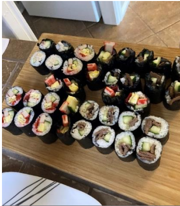
お友達家族とお寿司パーティー

先生、そして、この私の留学を支援してくださっているふるさと納税者の方々に本当に感謝しています。ありがとうございます。これからも感謝の気持ちを忘れずに頑張っていきます。