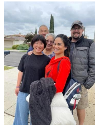
カルフォルニアでホストマザーの家族と