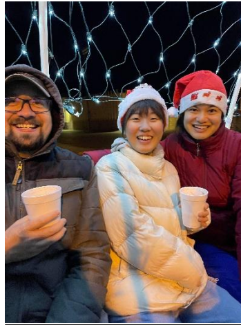
クリスマス馬車の中で