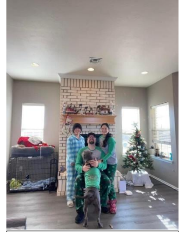
クリスマスパジャマパーティー