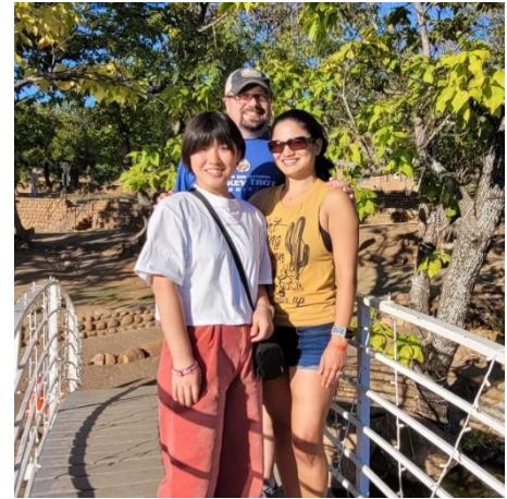
お気に入りの公園でホストファミリーと

最初は簡単な会話でさえも聞き取ることができず、自分がかかりすぎる日々でした。今ではホストファミリーとの会話も楽になり、ホストファミリーとの時間がとても楽しいです。私のホストファミリーは日本のことが大好きで、日本とアメリカの違いを話したり、お互いの家族の話をしたり、毎週金曜日に私が作る日本食もすごく喜んでくれます。学校では日本のお菓子を持って行って友達と食レポ動画を撮ったり、漢字を教えたりすることもありました。今まで出会った人のほとんどが日本のことが好きで、日本の話を聞くと本当にうれしくなります。私自身日本のことがもっと好きになりました。このような文化交流の時間は私にとって、とても楽しい時間です。アメリカの学校には様々なクラスがあります。ハンティングを学べるクラスまでありました。放課後にはシューティングチームを見に行きました。生徒がショットガンを使ってハンティング、または大会のために練習します。ルールの関係で、私は入ることができませんでしたが、日本では絶対にありえない光景を見ることができ楽しかったです。私達はロードトリップが大好きなので、週末は出かけることが多いです。土地が広いので目的地に行くまでにほとんど毎回2、3時間以上かかります。時には8時間かけて車で目的地まで行くこともありました。日本にいたときは遠いなと思っていた場所が、今ではそんなに遠くないと感じるようになりました。ホストファミリーも「行こうと思えばどこへでも行けるよ」と言って、いろんな場所に連れて行ってくれます。毎回冒険に出かけるような感覚でワクワクします。10月にはカリフォルニアに行って、ホストマザーの家族と過ごしました。ハリウッドサインや大きな植物園にも連れて行ってくれました。Thanksgiving holidayにはホストファザーの家族に会うためにミズーリ州に行きました。伝統的なThanksgiving dinnerを食べたり、家の近くにある林の中を探検したりして、数日ホストファザーの家族と過ごしました。クリスマスには友達とジンジャーブレッドハウスを作ったり、ホストマザーとケーキを作ったりしました。周りの人のおかげで、新しい文化も楽しく学ぶことができています。また、ホストファザーは、私と同じで自然が大好きです。これまで一緒にいろいろな場所の植物園や自然公園に行きました。見たことのない植物に出会えるので楽しいです。オクラホマ州には国立公園がありませんが、それでも自然を保護するための公園や場所が圧倒的に多いと感じました。