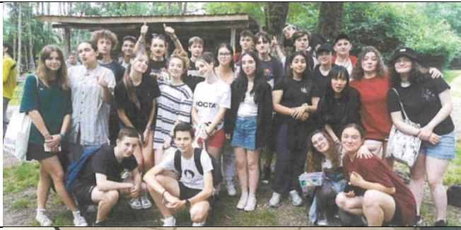
学校最後の校外学習として、ツリーピクニックに遊びに行った時の写真です。