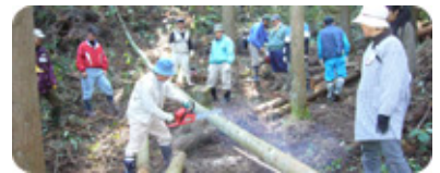
間伐で森を元気に

毎日の生活や企業の活動の中で努力しても、どうしても出てしまうCO 2 。そこで、企業・個人が資金を提供し、県内での植林・森林整備や太陽光発電設備の設置などのCO 2 削減活動を支援する取組みが、福井型カーボン・オフセット「環境ふくいCO 2 削減貢献事業」です。