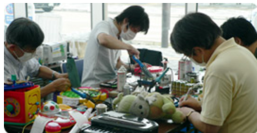
おもちゃの病院や古本市を開催