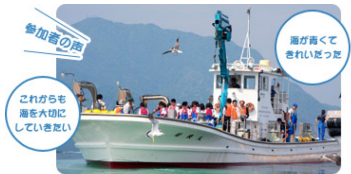
福井の海で船乗り体験