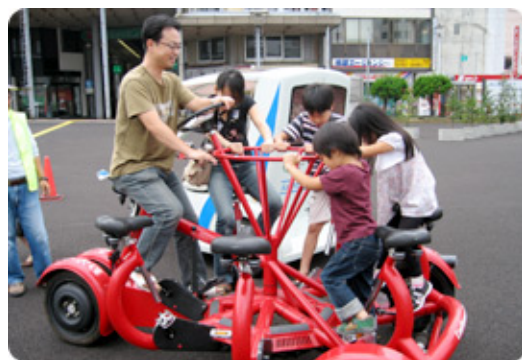
エコな乗り物大集合!