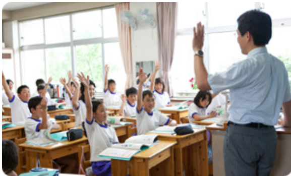
環境教材を用いた授業を受ける子どもたち

環境に関するスペシャリストが、地域の環境活動や環境に関する学習会などに講師として出向き、分かりやすく説明します。講師料・旅費の負担は不要です。小学校・町内会・企業等での環境学習会に、ぜひご活用ください！