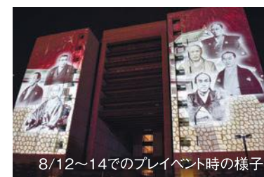
8/12~14でのイベント時の様子

場所/ 福井県庁(福井市大手) 図ブランド営業課 TEL:0776(20)0762 FAX:0776(20)0513