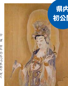
◀悲母観音綴織額(東京国立博物館蔵)