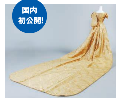
前田侯爵家伝来大礼服(成巽閣所蔵)▲

図福井市立郷土歴史博物館 TEL:0776(21)0489 FAX:0776(21)1489