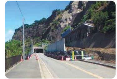
復旧が進む国道305号(越前町血ヶ平)