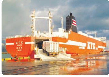
敦賀港に接岸するRORO船

来年4月、敦賀港と博多港の間にRORO船(トレーラーなどの荷物を積んだ車両ごと輸送できる貨物船)の航路が新たに開設されます。この航路での荷物の積み下ろし作業場所を確保するため、金ヶ崎と鞠山南地区のふ頭用地に照明設備と積み荷置き場を整備します。当面、博多便は週3便運航され、将来的にはさらに便数が増えていく予定です。既に就港している苫小牧便と合わせると、敦賀港は北海道から九州を結ぶ物流の重要な中継点となります。