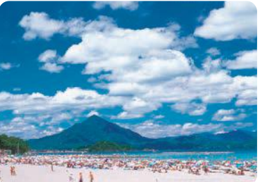
若狭和田海水浴場(高浜町)

2021年、概ね30歳以上なら誰でも参加できる生涯スポーツの国際大会「ワールドマスターズゲームズ2021関西」ライフセービング競技を高浜町で開催します。今後、県内に実行委員会を設置し、競技開催に向けた具体的な準備を進めます。国内外から多くの選手や大会関係者、観客の来県が見込まれることから、若狭の美しい海や自然、食文化の発信にも繋がります。大会は、2021年5月14日から30日までの17日間、福井を含め、関西各地において35競技が実施されます。