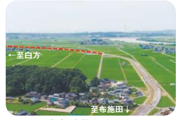
白方・布施田バイパス