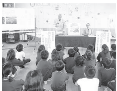
アースサポーターによる講座

家庭での省エネの実践や地域への呼びかけなどをボランティアで行う地球温暖化防止活動推進員(アースサポーター)を募集します。 対象／県内にお住まいの18歳以上の方 活動期間／22年4月～24年3月 申込締切／3月19日(金) 詳しくは アースサポーター 検索 ㊟環境政策課 0776(20)0302