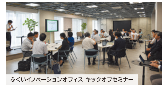
ふくいイノベーションオフィス キックオフセミナー