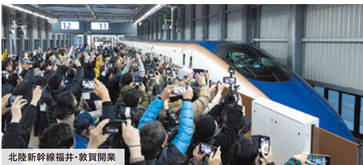
北陸新幹線福井・敦賀開業