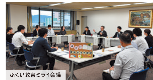
ふくい教育ミライ会議