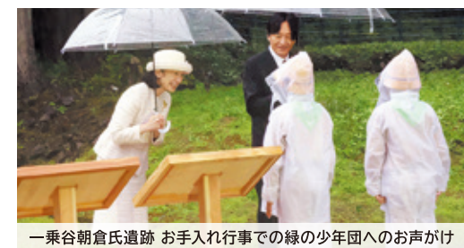
一乗谷朝倉氏遺跡 お手入れ行事での緑の少年団へのお声かけ