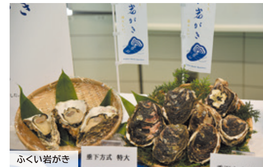
ふくい岩がき 藤下方式 特大