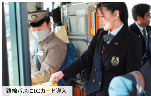
路線バスにICカード導入