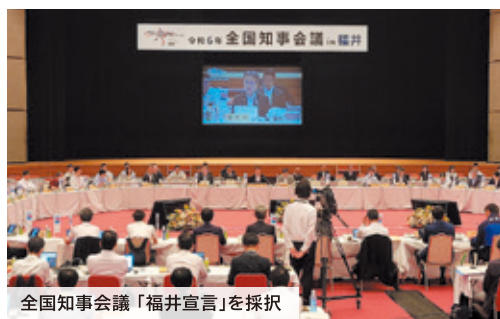
全国知事会議「福井宣言」を採択