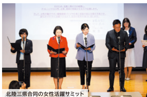
北陸三県合同の女性活躍サミット