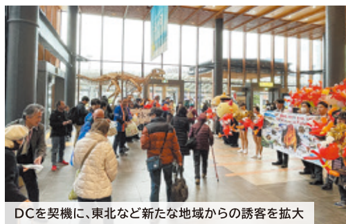
DCを契機に、東北など新たな地域からの誘客を拡大