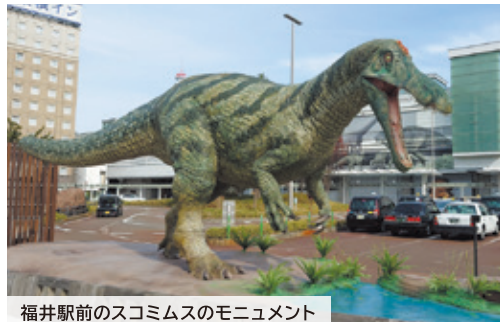
福井駅前のスコミスのモニュメント