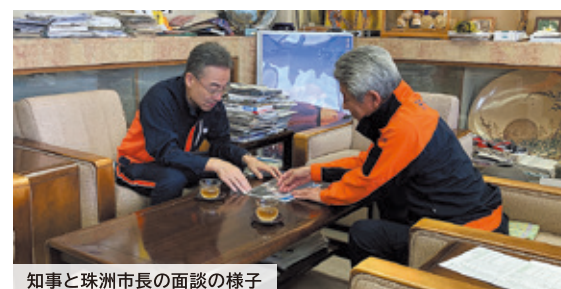
知事と珠洲市長の面談の様子