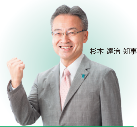
杉本 達治 知事

北陸新幹線福井・敦賀が開業し、新たな時代が幕を開けた福井県。県政を飛躍させる100年に1度のチャンスを迎えた1年を振り返ります。