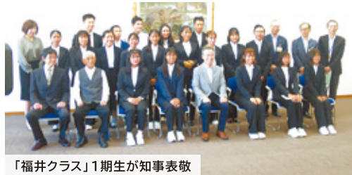
「福井クラス」1期生が知事表敬