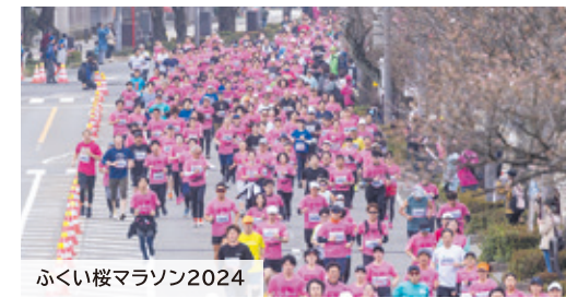
ふくい桜マラソン2024