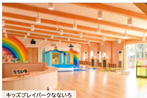
キッズプレイパークなないろ