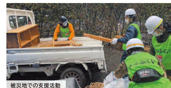
被災地での支援活動