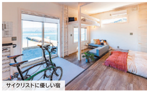
サイクリストに優しい宿