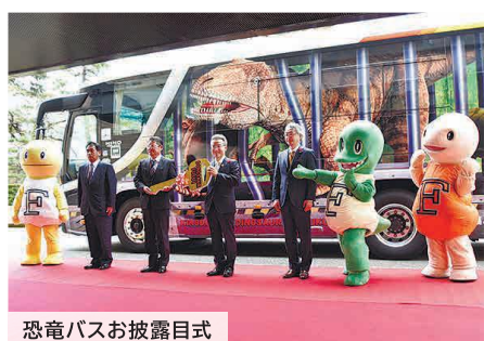
恐竜バスお披露目式