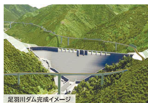
足羽川ダム完成イメージ