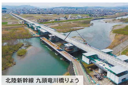
北陸新幹線 九頭竜川橋りょう