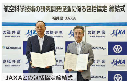
JAXAとの包括協定締結式