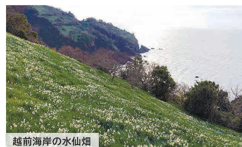
越前海岸の水仙畑