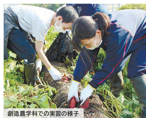
創造農学科での実習の様子