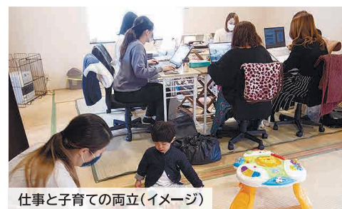
仕事と子育ての両立(イメージ)