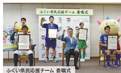
ふくい県民応援チーム 委嘱式