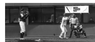
試合動画配信のイメージ