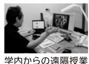
学内からの遠隔授業