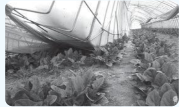
園芸ハウスの被害の様子

今回の大雪により、施設の損壊や売り上げの減少など被害を受けた方に対して支援を行います。