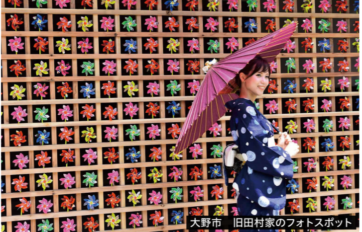
大野市 旧田村家のフォトスポット