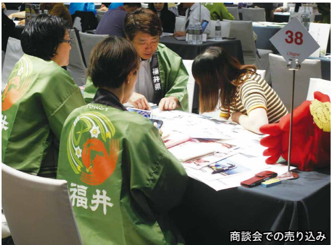
商談会での売り込み

訪日外国人は昨年3000万人を突破し、福井県でも外国人宿泊者数が年々増加しています。東京2020オリンピック開催や北陸新幹線福井・敦賀開業の機会を生かし、増加する訪日外国人旅行(インバウンド)を福井に呼び込んでいきます。