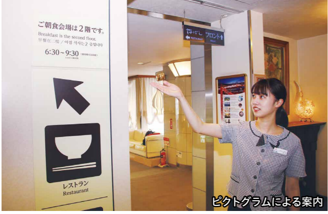
ピクトグラムによる案内