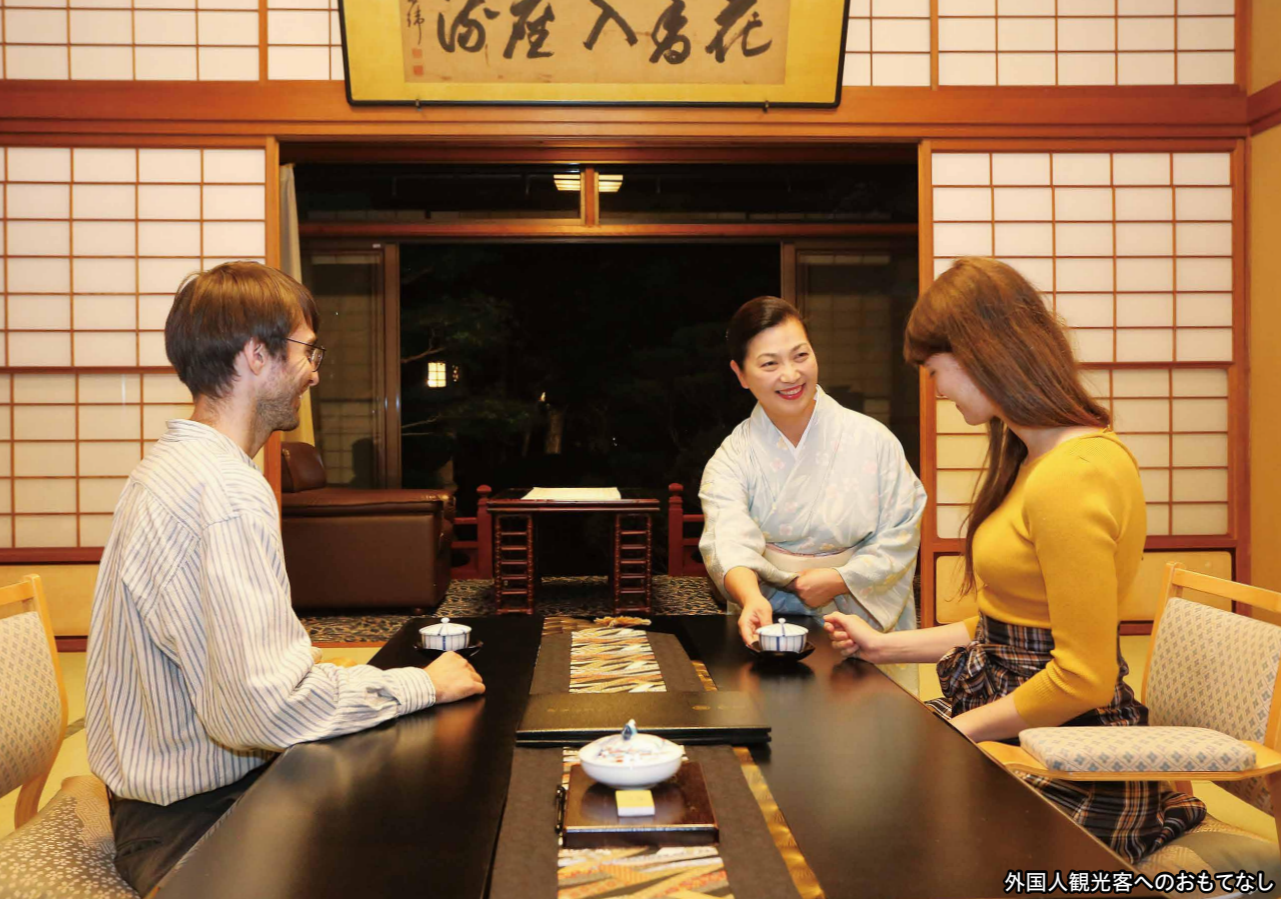
外国人観光客へのおもてなし