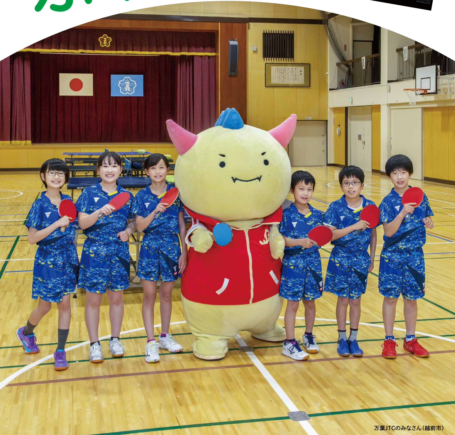
万葉JTCのみなさん(越前市)