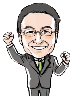
知事 杉本 達治

子どもはふくいの子宝です。保育料無償化の拡充や全天候型の遊び場および男性が利用しやすい乳幼児用設備の整備、男性の育休取得などを進め、子育てがしやすくなるよう取り組んでいきます。