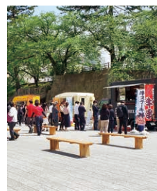
4、5月にはキッチンカーの出店イベントを開催！

●県庁前広場をリニューアル 今年3月に県庁前広場を改修しました。様々な目的に使えるよう全面舗装化し、これまでであった段差もなくなりました。今後、様々なイベントで活用していきます。 現場でトーク 県が取り組む施策や計画について