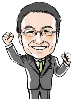
知事 杉本 達治

新博物館は、全国に誇る中世都市遺跡の価値や魅力を十分に楽しんでいただける施設となっております。ここを拠点に、一乗谷のさらなる魅力向上とファン獲得に向けたしかけづくりを進め、日本最大の戦国フィールドミュージアムを目指します。