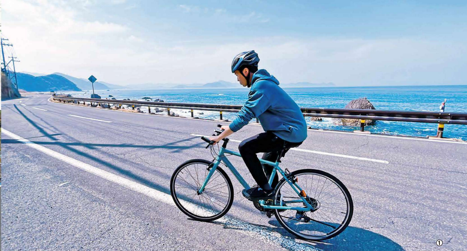
①若狭湾に臨む県道33号佐田竹波敦賀線 ②若狭湾サイクリングルート ③矢羽型路面標示が設置された道路を走行する様子