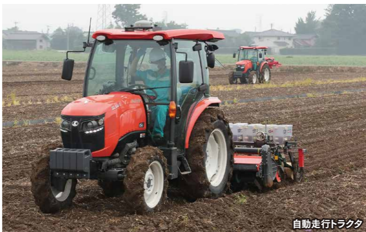
自動走行トラクタ