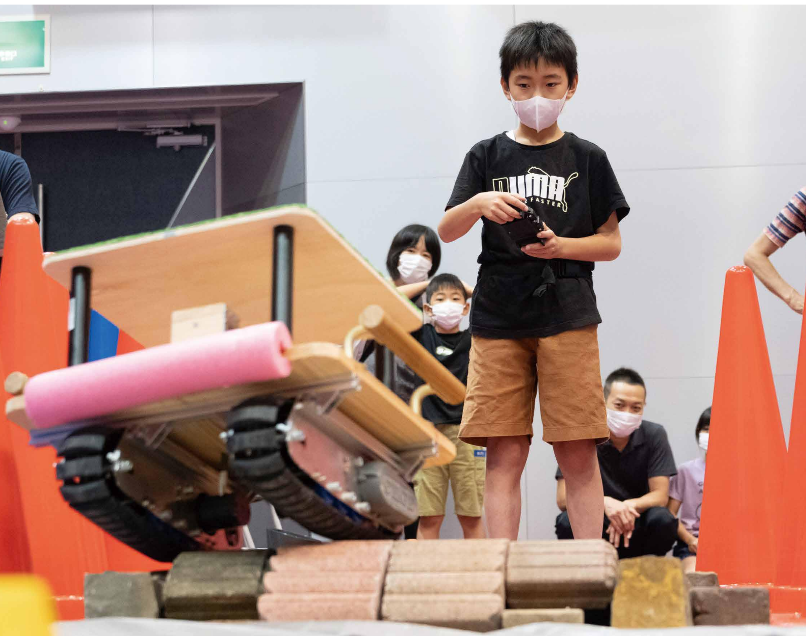
ロボットなど最新技術の体験会