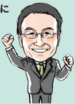
知事 杉本 達治