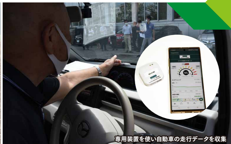
専用装置を使い自動車の走行データを収集