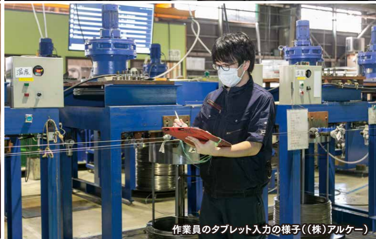
作業員のタブレット入力の様子