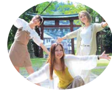
さくらいと 福井伝統工芸アイドル

福井県出身のMAI、WAKANA、HIYORIで構成された福井伝統工芸アイドル。越前若狭の伝統工芸を応援しながら、ライブ活動などを実施!2023年にサンドーム福井でライブを行う予定で、35名の巨大グループを目指している。