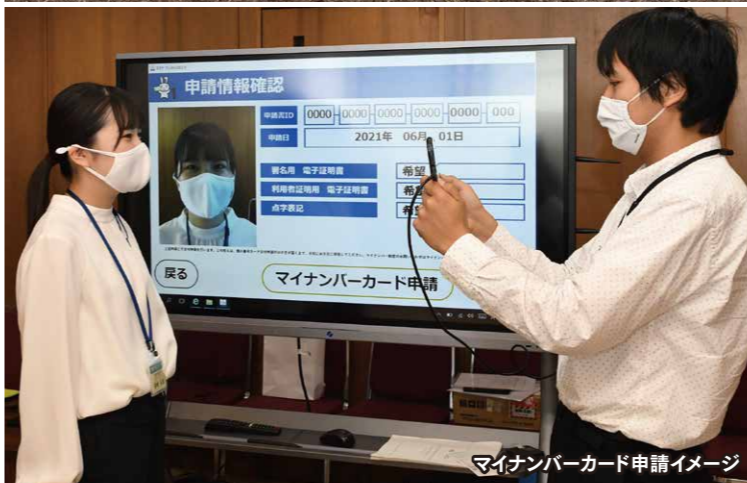
マイナンバーカード申請イメージ