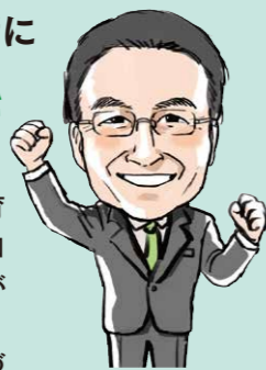
知事 杉本 達治