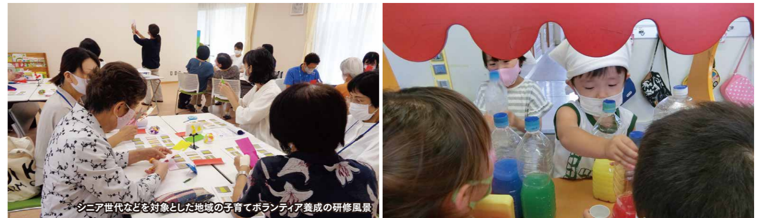
シニア世代などを対象とした地域の子育てボランティア養成の研修風景