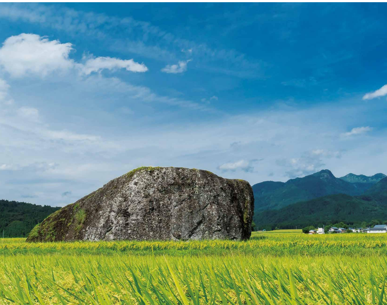
数万年前の地殻変動などの影響で出現したと考えられている大野市の巨大岩