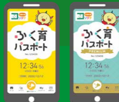
【通常パス】 【プレミアム】