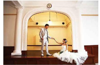
歴史的建造物の魅力的な活用を促す コンシェルジュプロジェクト(旧大和田銀行本店本館)

の支援を行っていません。現在進めている国指定の重要文化財「大安禅寺」(福井市)の修復工事は、平成30年から令和11年まで12カ年、国の補助も含め総事業費約22億円という、全国的にも大規模な事業です。このように古い建物の修理には多くの費用と時間が必要となるため、早期に劣化部分