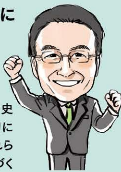
知事 杉本 達治

文化は豊かな社会づくりの基盤です。長い歴史の中で先人達が培ってきた歴史・文化を大切に保存し、次代へ引き継いでいきます。また、それらをネットワーク化して発信し、観光振興や地域づくりに活用していきます。