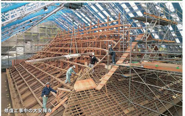
修復工事中の大安禅寺