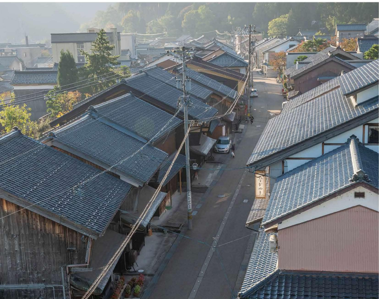
国重要伝統的建造物群保存地区に選定される今庄宿(南越前町)