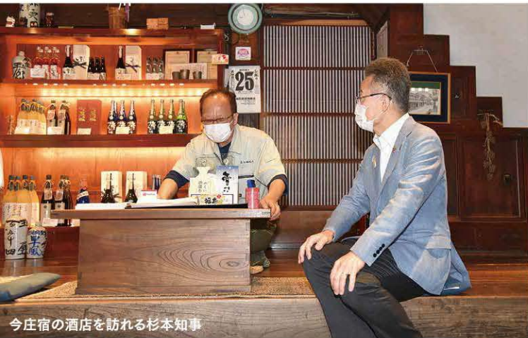
今庄宿の酒店を訪れる杉本知事