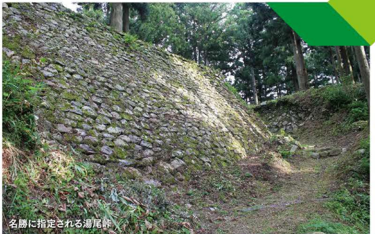
名勝に指定される湯尾峠