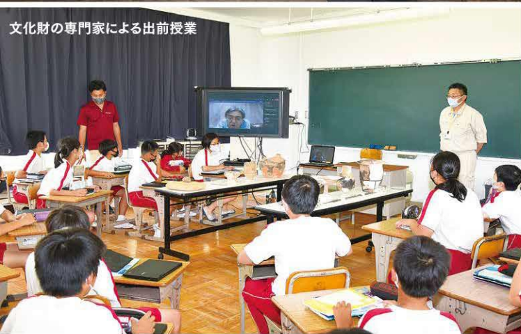
文化財の専門家による出前授業