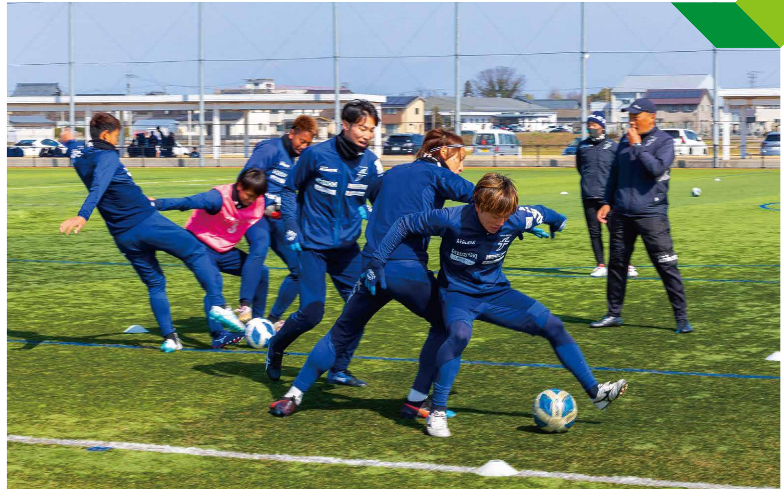
練習に励む福井ユナイテッド FC の選手たち