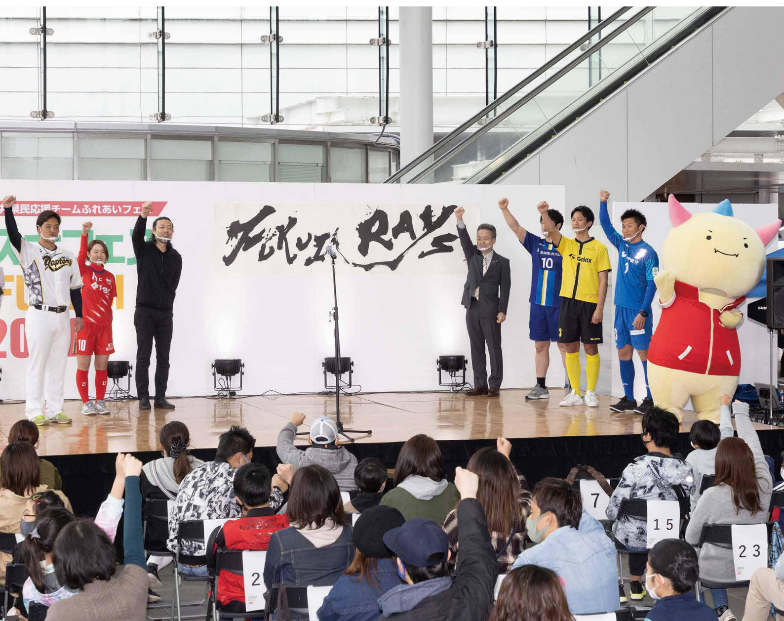
「ふくい県民応援チーム」の愛称が「FUKUI RAYS」に決定!