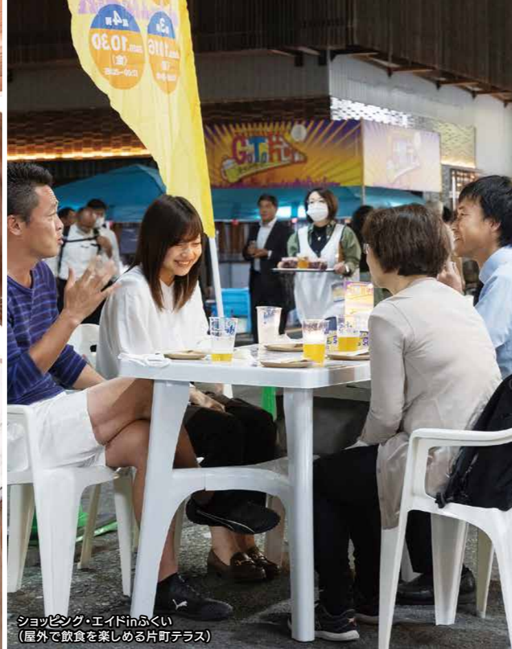
ショッピング・エイドinふくい (屋外で飲食を楽しめる片町テラス)