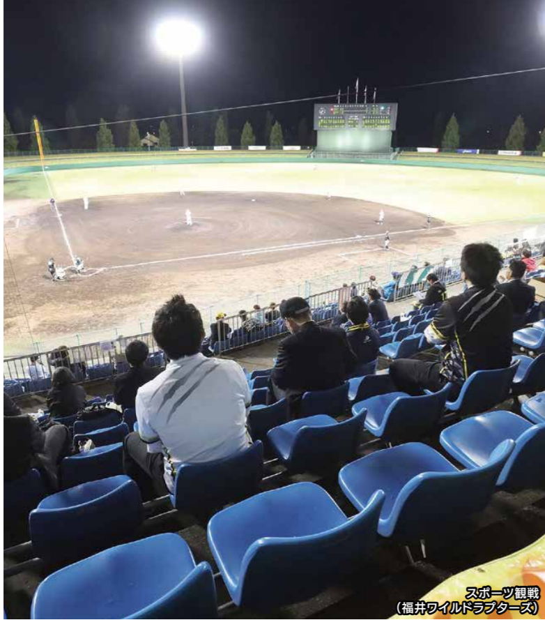
スポーツ観戦 (福井ワイルドドラゴンズ)