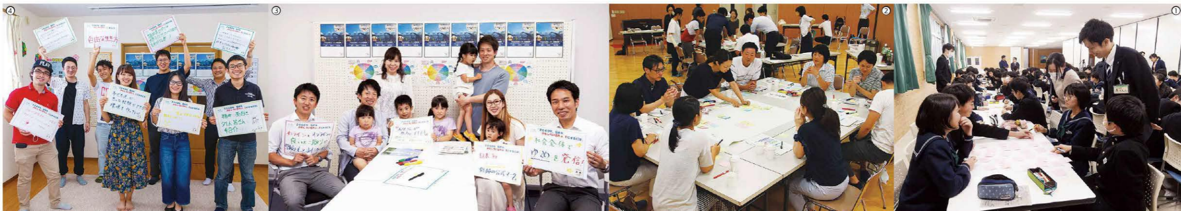
①出前講座(高志中学校)

交通体系の進展や技術革新を活かして、産業の新たな可能性を拓く。創造的で活力ある「ふくい」 変化をチャンスに、しごととくらしを創造。