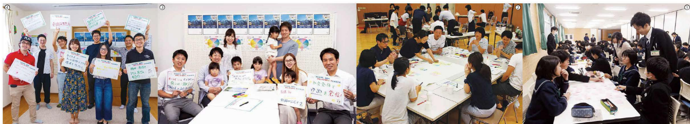
①出前講座(高志中学校)