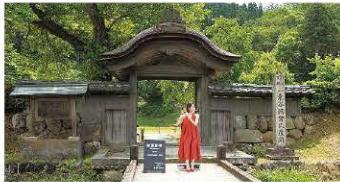
6月9日(火)一乗谷朝倉氏遺跡での様子

①7月29日(水)10時～10時30分 ②8月6日(木)14時～14時30分 所①若州一滴文庫(おおい町岡田) ②熊川宿(若狭町熊川) 詳各市町のまちかどを会場に、福井県ゆかりのアーティストによるミニコンサートを開催します。