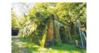
日本遺産に認定された、敦賀一今庄間で最長の山中トンネル

【表紙の写真】 構成文化財のひとつ「伊良谷(いらだに)トンネル」の中から敦賀市側を見たところ。芦谷・曲谷トンネルと3つのトンネルが連続して見通せる全国的にも珍しいアングルです。