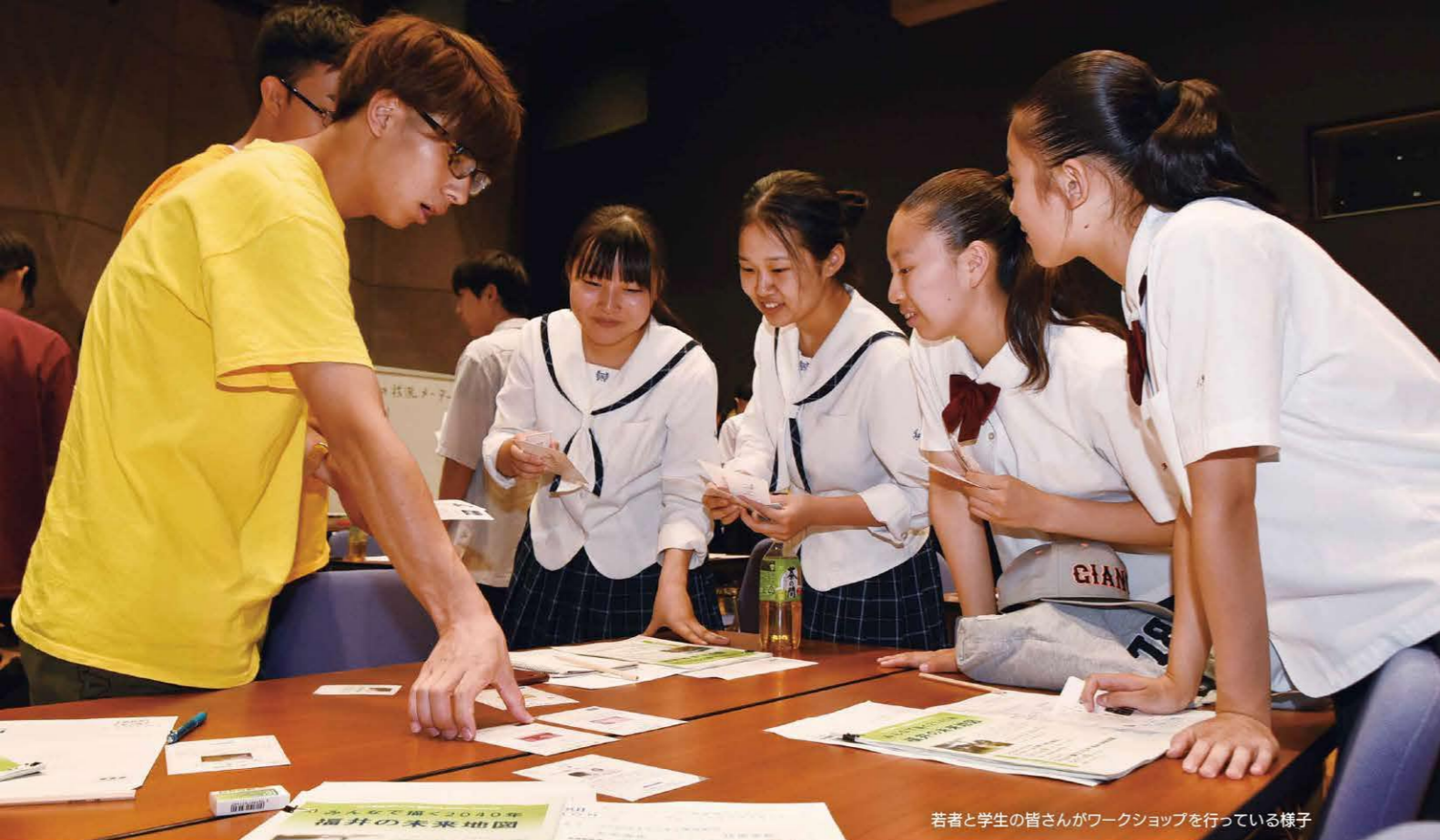
若者と学生の皆さんがワークショップを行っている様子

ハード・ソフトの両面から観光地やまちの魅力を磨き上げ、多くの人を呼び込むほか、音楽やアートによるにぎわいづくりを進めます。また、「次世代ファースト」の観点から、創業や事業承継の支援、新しい働き方へのシフトなどを進め、若者に魅力がある仕事をつくり、とがった企業・人材を増やします。