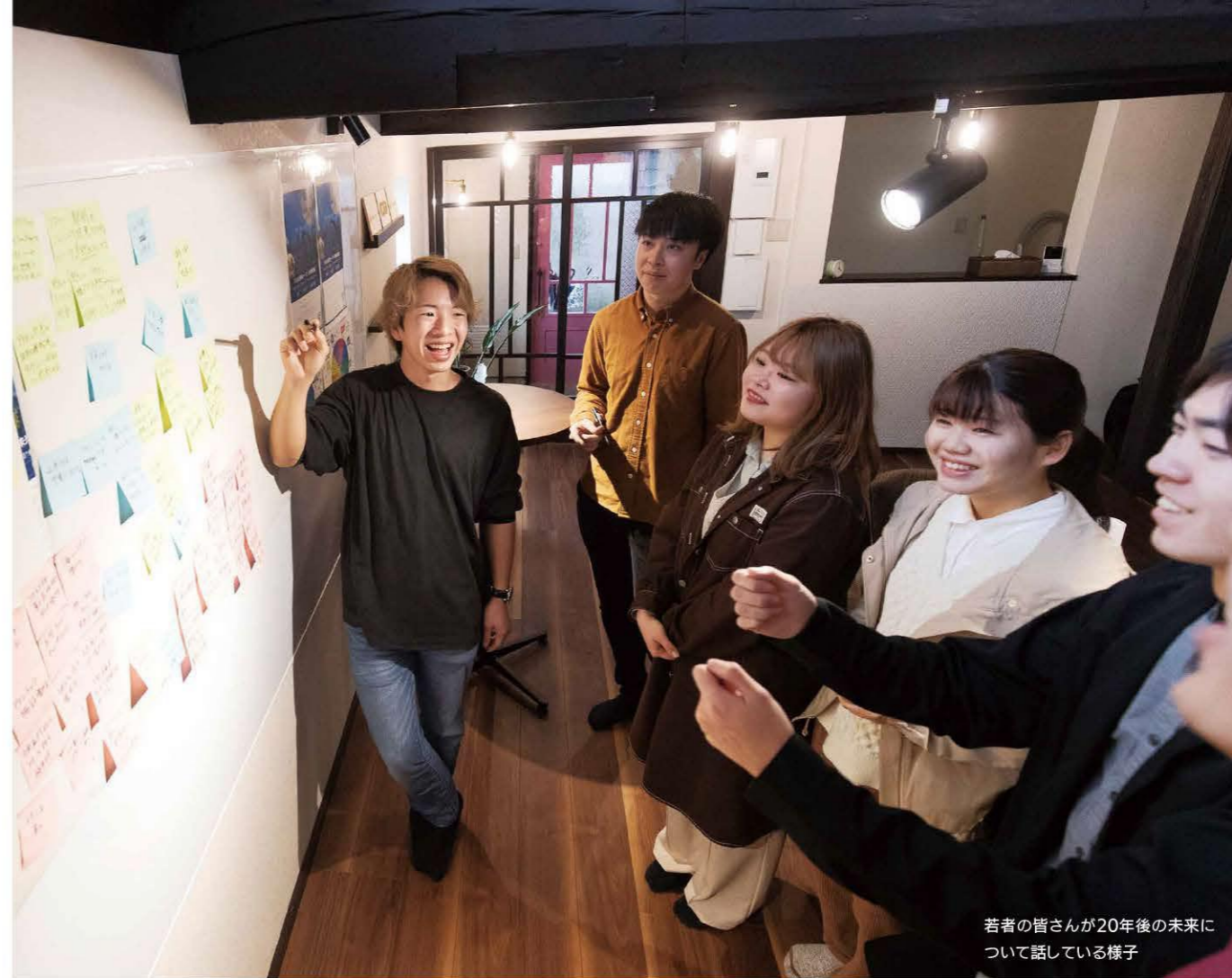
若者の皆さんが20年後の未来について話している様子

2040年の福井の将来像を共有するため、県民の皆さんと一緒につくってきた「福井県長期ビジョン」がこのたび完成しました。目指す姿を実現するため、「チームふくい」で力を合わせ行動していきます。