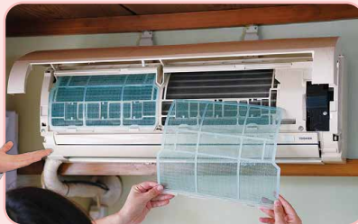
フィルター掃除で、 エアコンの効きもアップ