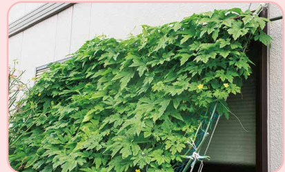
強い日差しを遮る 自然のカーテン