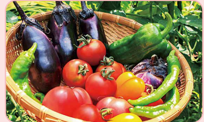
暑い時期は 体の中から涼しくしてくれる夏野菜を 地産地消でおいしくエコ

専用ホームページに「エコチャレ」を投稿された方の中から抽選で景品をプレゼントしています。 夏を涼しく過ごせるように、みんなで考えて実践してみましょう!!