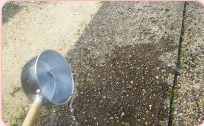
打ち水で熱い地面の温度も下がり、 体感温度が下がる効果も