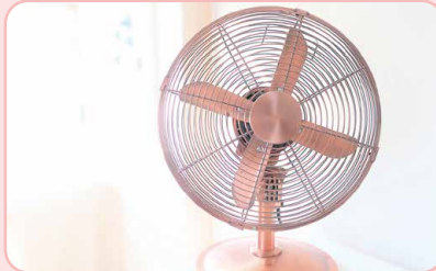
扇風機とエアコンの併用で 省エネ促進 (涼しい時間帯は窓を開けて換気を)