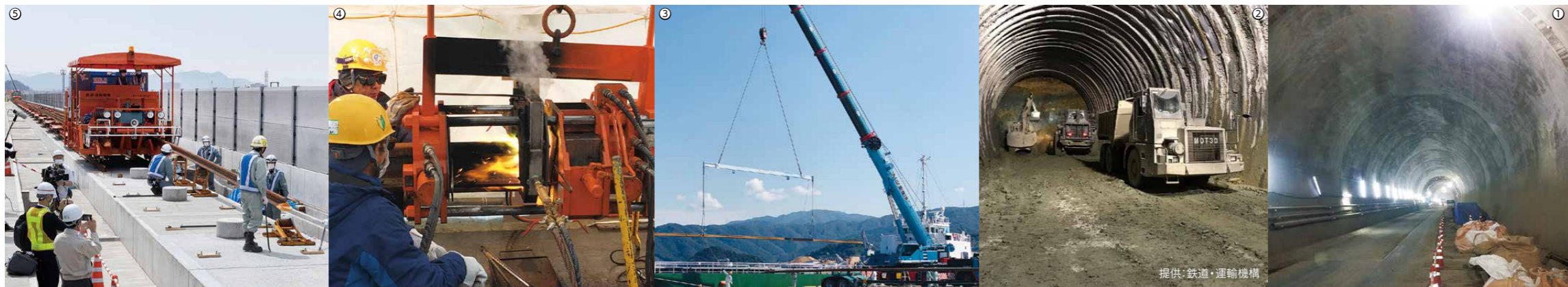
①②工事が進む新北陸トンネル ③船で輸送されたレールを陸揚げ(敦賀港) ④約1200℃の高温で行うレールの溶接作業 ⑤県内で最初にレール敷設が始まった福井高柳高架橋