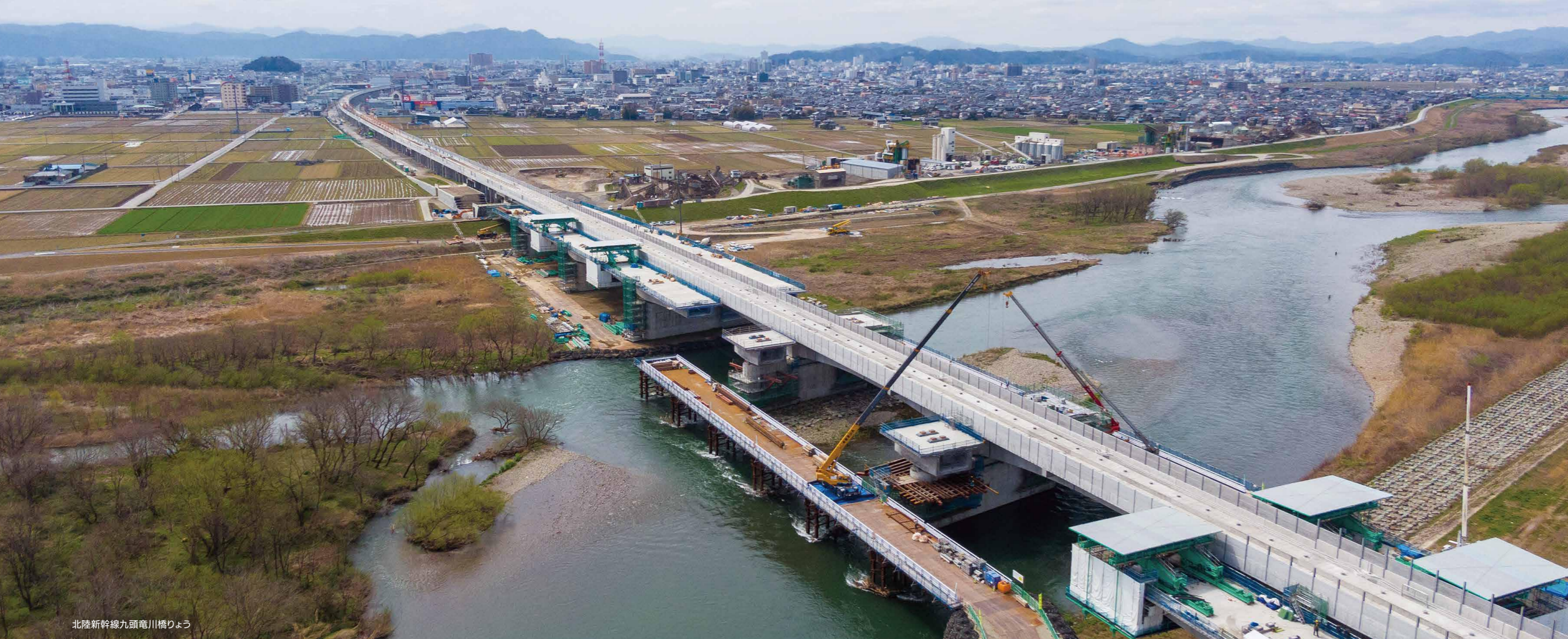
北陸新幹線九頭竜川橋りょう