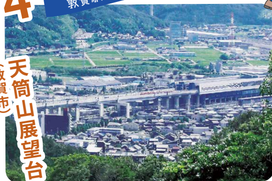
天筒山展望台から (敦賀市)