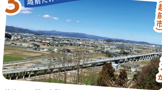
岩内山視点場から (越前市)

JR越前たけふ駅の東側にある低山。駅から徒歩で約15分の距離にあり、駅から出入りする新幹線が撮影可能。滑りにくい靴での登山がオススメです。