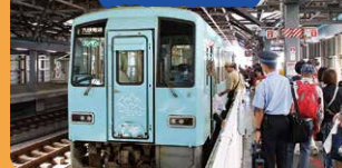
笏谷石色の列車がふくいを駆け抜けます