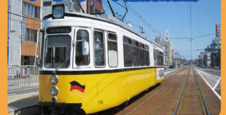
ドイツ製観光電車