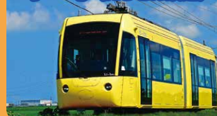
色が可愛くて人気の電車!