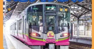
2024年3月16日(土)から運行を開始!