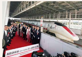
9月23日 初入線歓迎式典

9月23日には、新幹線電気・軌道総合検測車「East-i(イーストアイ)」が走行試験を開始。新幹線車両の初入線を記念し、芦原温泉駅で歓迎式典を開催しました。続く9月26日、北陸新幹線車両「W7系」が走行試験を開始し、10月1日には、芦原温泉駅・福井駅・越前たけふ駅・敦賀駅の各駅で歓迎セレモニーが行われ、県民のみなさんが車両の到着を歓迎しました。