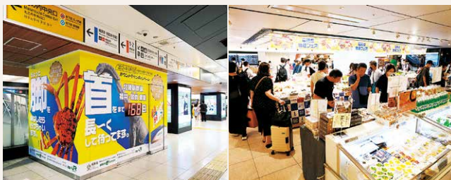
9月30日 カウントダウンキャンペーン(東京都)

また、9月30日から10月9日には、JR東京駅と周辺施設でカウントダウンキャンペーンを開催。キャンペーンでは、開業カウントダウンボードの設置、福井県コラボ巨大プラレールジオラマの展示、県産食材や伝統工芸品の販売、県や市町の観光PRなどを行い、会場は大いに盛り上がりました。