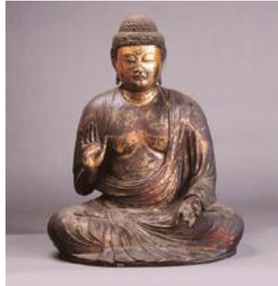
木造 釈迦如来坐像(慈眼寺蔵)

詳仏教美術の基本ともいえる釈迦如来の造形を、若狭に伝来する文化財から紹介します。