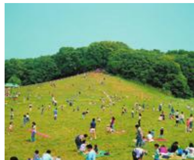
土田ヒロミ「新・砂を数える「横浜」」

■写真展 土田ヒロミのニッポン 5月23日(火)まで ㊦日本を代表する福井県出身の写真家・土田ヒロミさんの作品を紹介します。