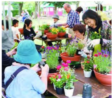
花づくりの体験講座

来県する選手や観客等を美しい景観でおもてなしするため、街中を花で彩る「花いっぱい運動」を推進中です。