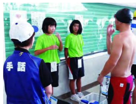
情報支援ボランティア

◎福井国体障スポボランティア 検索 ◎大会推進課 0776・20・0726 ◎障害者スポーツ大会課 0776・20・2152