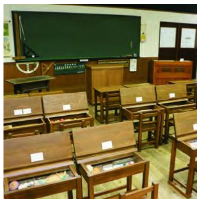
教育総合研究所(教育博物館)

学力・体力トップクラスの福井県において、教員の指導力向上の拠点となる研究所です。4月15日、教育研究所を旧春江工業高校施設へ移転したのに伴い、機能を強化しました。高度な理科実験ができるサイエンスラボを設けたほか、ICT(情報通信技術)を使った遠隔授業・教員研修を行います。また、福井の教育について学ぶことのできる教育博物館を開設しました。