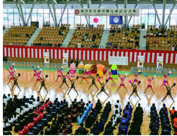
新しくなった県営体育館