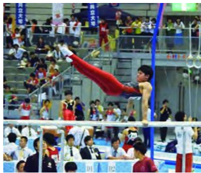
体操競技のプレ大会