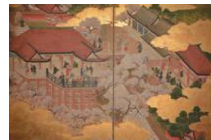
「東山遊楽図」(左隻部分)個人蔵

■「日本の春を満喫!」/「新収蔵品 展-重文の刀と源氏物語図屏風」 4月5日(水)～25日(火) 「東山遊楽図」(左隻部分)個人蔵 福井市文京3-16-1 ☎0776-25-0452 開9時～17時(入館は16時30分まで) 料一般・大学生100円、高校生以下・70歳以上無料