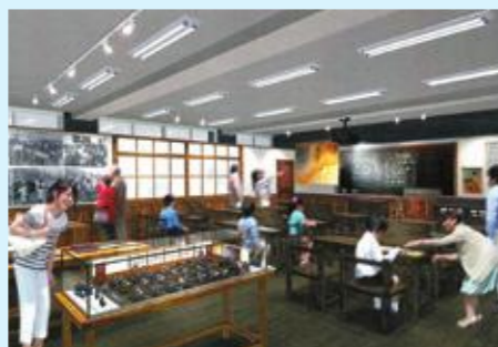
なつかしの学び舎(イメージ)

福井の教育の歴史や福井ゆかりの教育者を紹介するほか、昭和の教室を再現した「なつかしの学び舎」も登場。楽しみながら、福井の教育に触れることができます。 所 坂井市春江町江留上緑8-1 (教育総合研究所内) ☎0776-58-2250 開9時～17時(4月15日は13時～17時) 休月曜(祝日を除く)、祝日の翌日