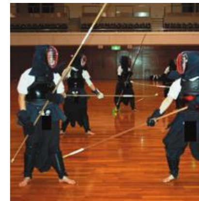
福井市三ツ屋町8-1-1 ☎0776-26-9400 開8時30分～21時(日祝17時まで) 休月曜(祝日を除く)、祝日の翌日

■前期武道学園 ㊤㊦ 4月9日(日)～9月24日(日) ◇40回コース 柔道、剣道、空手道、なぎなた(夜) ◇20回コース 弓道(昼・夜)、なぎなた(昼)、銃剣道、相撲 対小学生以上 ※弓道は小学5年生以上、 (昼)は一般のみ 料40回コース6170円 20回コース3085円 ※別途スポーツ保険料等が必要 中学生以下820円 高校生以上1870円 65歳以上1220円 受4月1日(土)～9日(日) 開館日の8時30分～20時 (日祝16時まで) 他開催日時、定員等はホームページ で確認